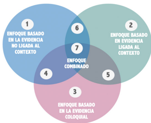
Figura 3. Tipos de enfoques informados en la evidencia para la identificación de potenciales candidatos