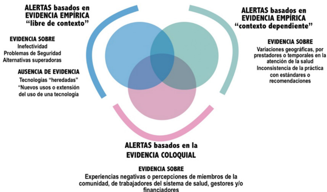
Figura 4. Tipos de alerta según tipo de evidencia