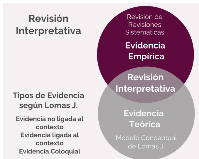
Figura 1. Evidencia empleada en el diseño del marco para la identificación de potenciales candidatos a desinversión.

Una de las primeras preguntas que se hacen los financiadores, los proveedores de servicios, las agencias de ETS es por dónde empezar teniendo en cuenta las miles de intervenciones actualmente en uso. En este contexto, y particularmente en países de bajo y mediano ingreso, con restricciones fiscales severas, la identificación de tecnologías que representan una asignación ineficiente de los recursos en salud, constituye, más que una necesidad, un imperativo.