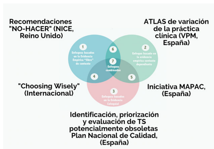
Figura 6. Aplicación del MIdCanDes en distintas iniciativas internacionales de desinversión sanitaria

Existen múltiples iniciativas a nivel mundial con foco en la desinversión, la mayoría de las cuales son promovidas por agencias de gobiernos nacionales o locales o, en otros casos, por sociedades científicas, como en el caso de la iniciativa “Elegir Sabiamente”. En cualquier caso, todas identifican potenciales candidatos a desinversión, aunque el enfoque que emplean es diferente. Se presentan a continuación algunos ejemplos (figura 6).